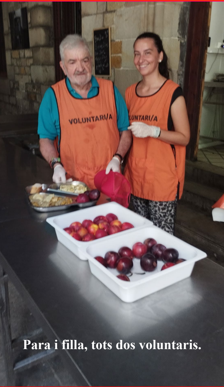
Para i filla, tots dos voluntaris.