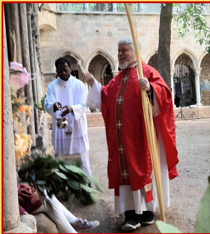
Benedicció dels Rams, en el claustre, i Eucaristia