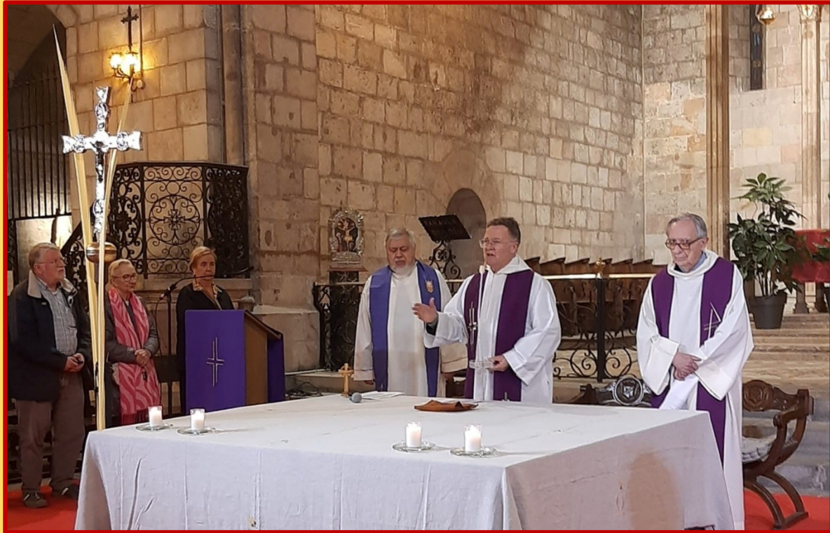
Celebració de la Reconciliació