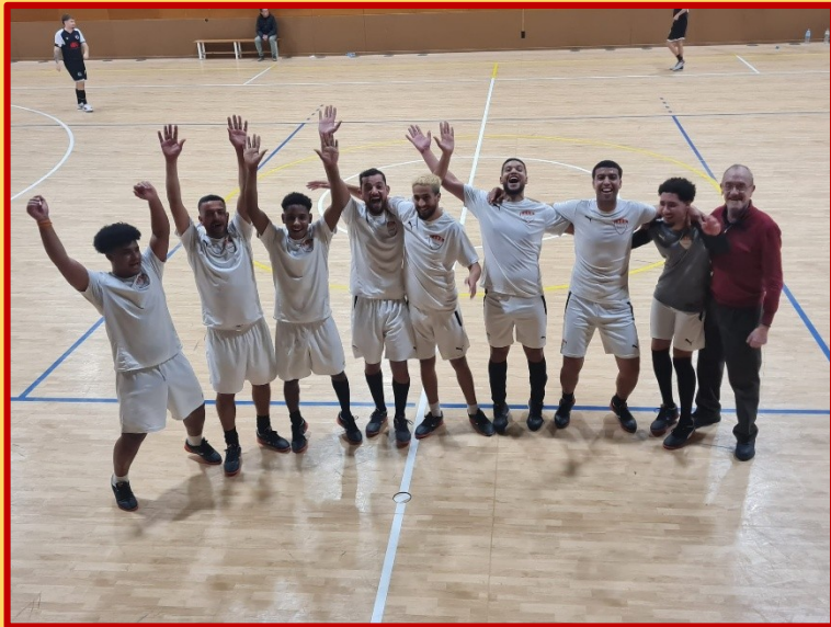
EQUIP DE LA MASSIA