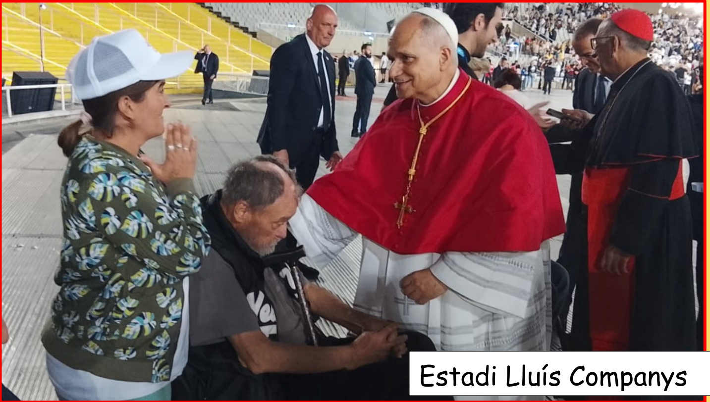
Estadi Lluís Companys