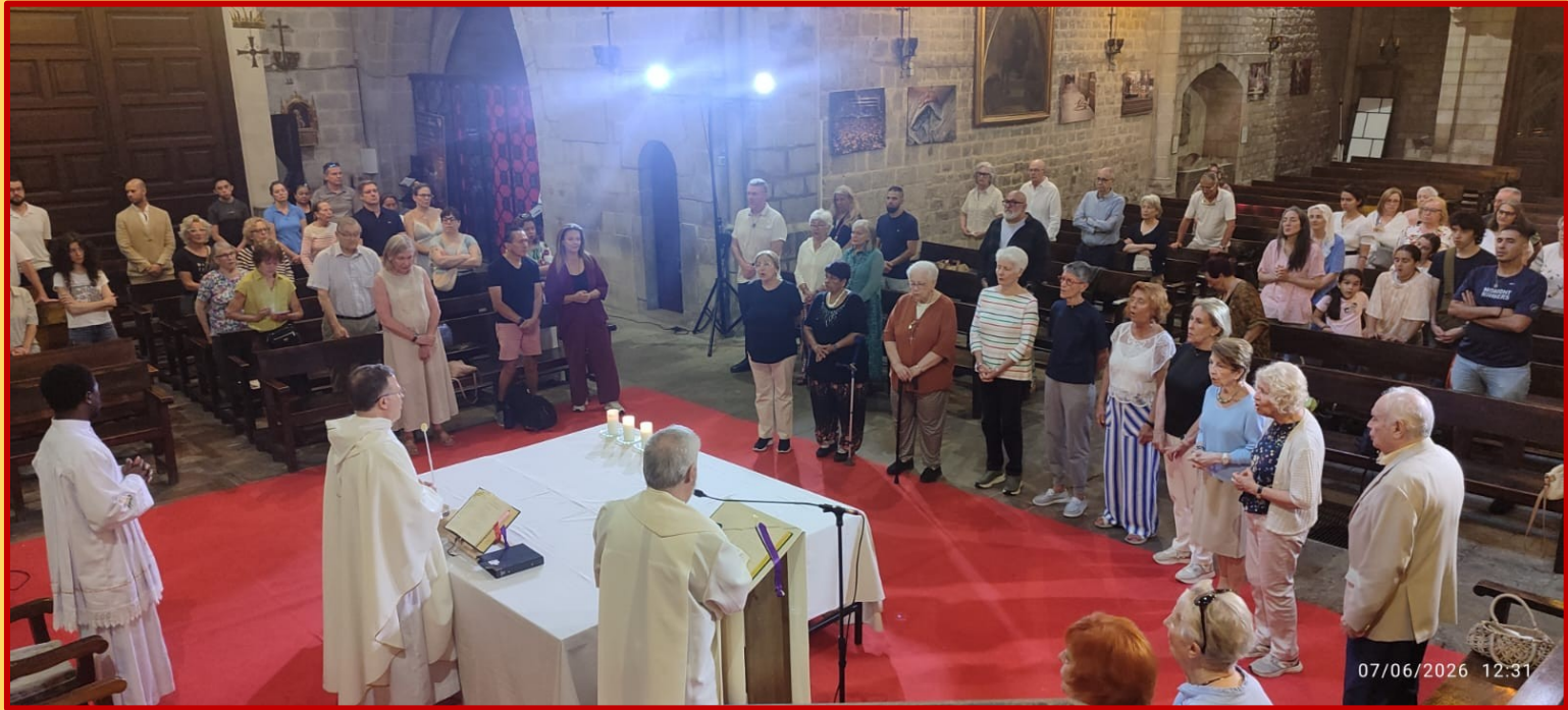
Administració de la Unció de Malalts a un grup de persones.